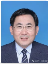
王兴军 | 北京大学博雅特聘教授

北京大学博雅特聘教授、长江学者、国务院学科评议组成员、美国光学学会会士、中国通信学会/中国光学学会/中国光学工程学会会士。近五年，以第一作者/通讯作者在NS系列期刊发表20余篇，包括Nature 3篇。主持科技部重点研发项目、国家自然科学基金重大仪器项目等十多项国家级项目。代表性成果入选中国十大科技进展、中国信息通信领域十大科技进展、中国光学十大进展等奖项，获得北京市科学技术奖自然科学一等奖。